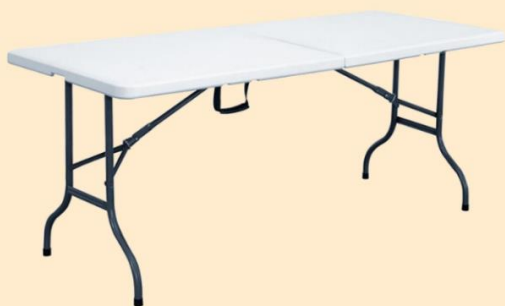
Table pliante 3x

Nous contacter ? bibliotheque@perwez.be ou 0471 36 75 76